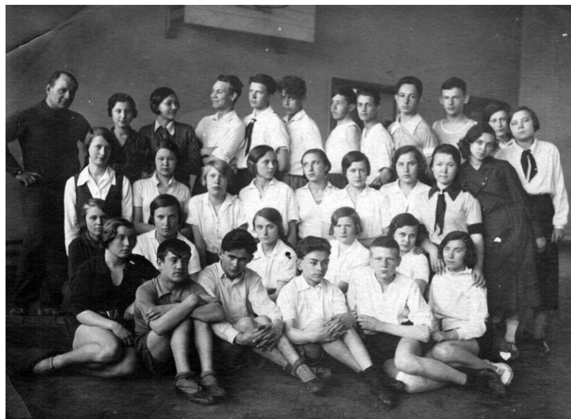
Москва. 8 кл. шк. 48 Дзержинского ОНО