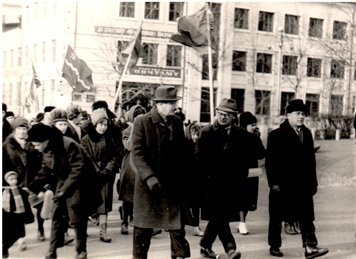
Улан-Удэ. ВСГБИ. 1967