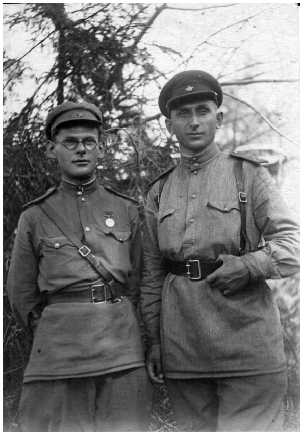
После битвы за Москву 1942