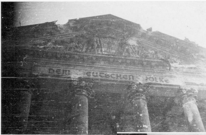
Берлин 2 мая 1945 г.