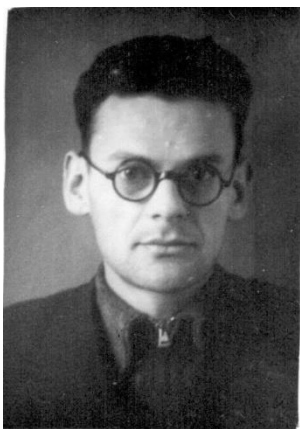
Накануне призыва 1941 г.