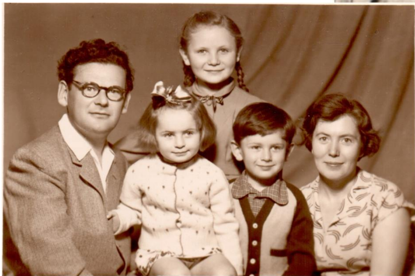
Москва. МГБИ. 1949 г.